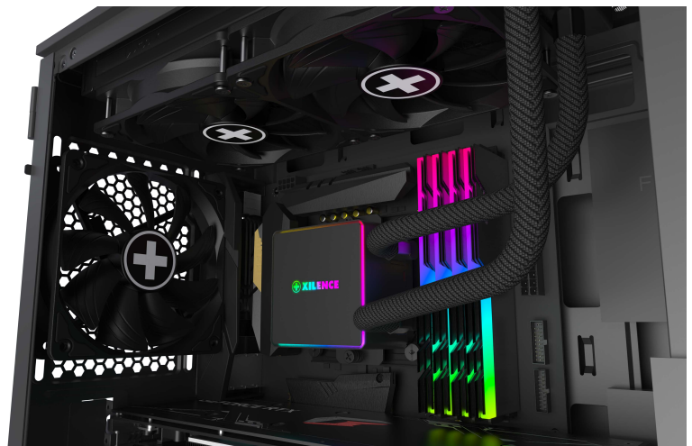
Beispieldarstellung der Wasserkühlung LQ240PRO in einem PC-Build.